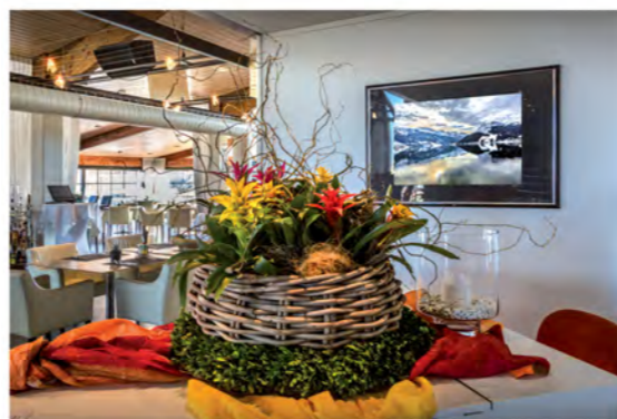
Ausstellungsblick ins Restaurant Golfpark Nuolen, Wangen SZ.