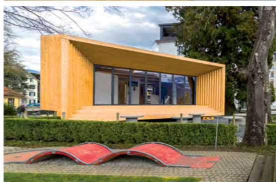
Blick auf den Holzpavillon des Vereins «Pro Holz Schwyz» an der Seepromenade neben dem Seehotel Waldstätterhof, Brunnen SZ.